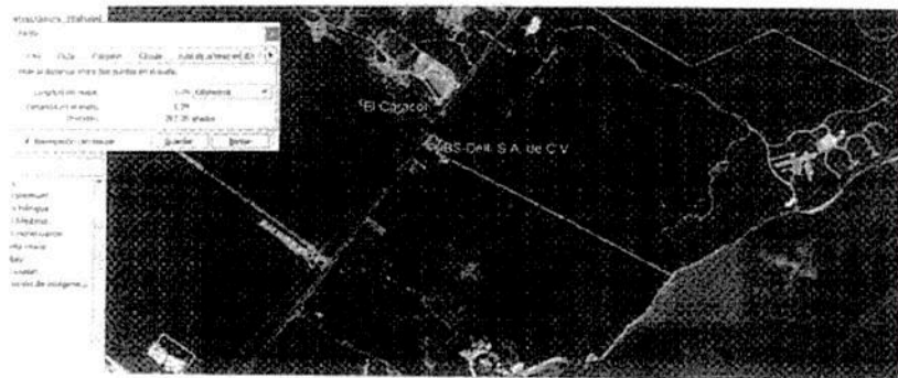
FIGURA 1.3 UBICACIÓN DEL PROYECTO CON RESPECTO A LA ZONA MARINA

Así mismo al no estar delimitada la zona costera nacional por parte de la autoridad (secretaría, en colaboración con las entidades federativas y los municipios) a la fecha el proyecto se encuentra dentro de un ECOSISTEMA COSTERO. (...)