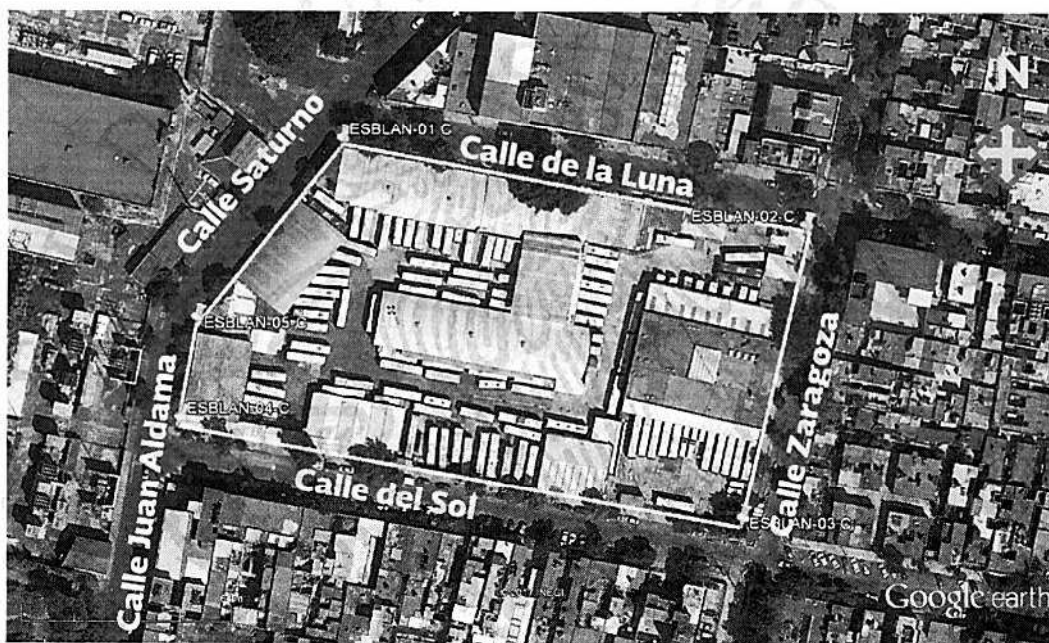
Figura 1. Coordenadas de localización del sitio.