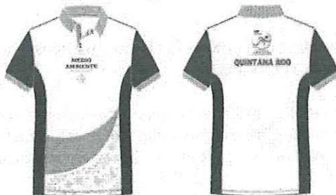
IMAGEN DEL UNIFORME