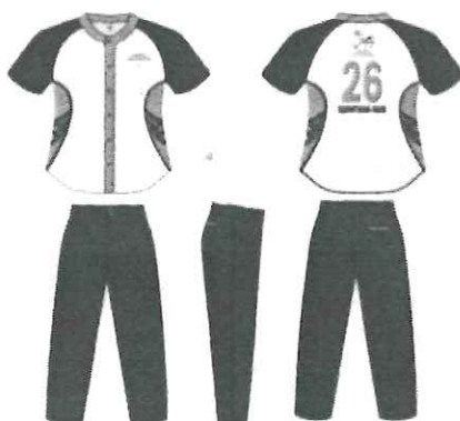
IMAGEN DEL UNIFORME:

Medias para béisbol Unitalla, color blanco, base blanca punta y talón reforzada, 90% poliamida y 10% elastano.