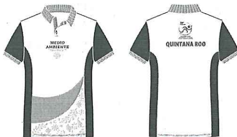
IMAGEN DEL UNIFORME