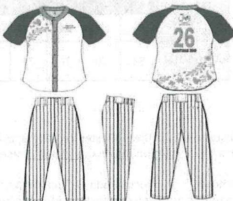
IMAGEN DEL UNIFORME:

Medias para béisbol Unitalla, color blanco, base blanca punta y talón reforzada, 90% poliamida y 10% elastano.