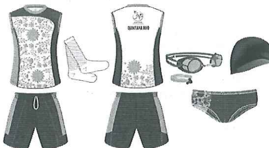
IMAGEN DEL UNIFORME BIATLÓN

Gorra para natación y uso Deportivo, de forma circular, Anatómica y ergonómica Unitalla, con elástico 5 gajos unidos con maquina over lock Color Negro.