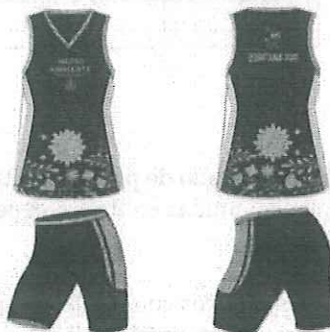
IMAGEN DEL UNIFORME: