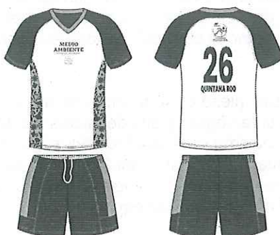
IMAGEN DEL UNIFORME:

Medias para Fútbol Unitalla, color blanco, base blanca punta y talón reforzada, 90% poliamida y 10% elastano.