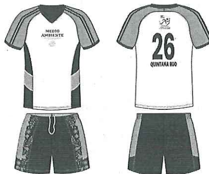
IMAGEN DEL UNIFORME:

Medias para Futbol, unitalla, color blanco, base blanca punta y talón reforzada, 90% poliamida y 10% elastano.