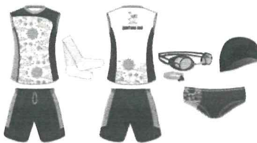
IMAGEN DEL UNIFORME BIATLÓN

Gorra para natación y uso Deportivo, de forma circular, Anatómica y ergonómica Unitalla, con elástico 5 gajos unidos con maquina over lock Color Negro.